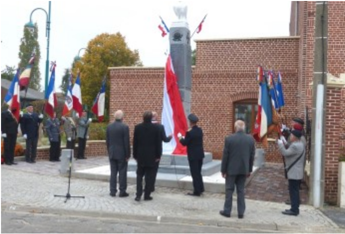
Le dévoilement par Monsieur le Sous-Préfet et Monsieur le Maire