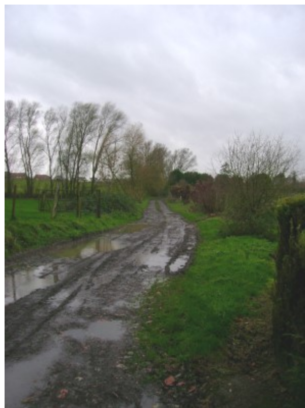
L'élagage des arbres du chemin du Mont de la vigne