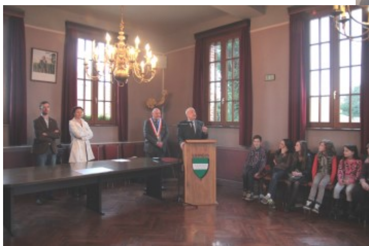
Installation du conseil municipal des jeunes en présence de M. Dolez, député du Nord, le 19 décembre