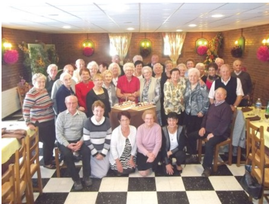
Repas au restaurant « les 4 canaux » à Courchelettes le 9 octobre