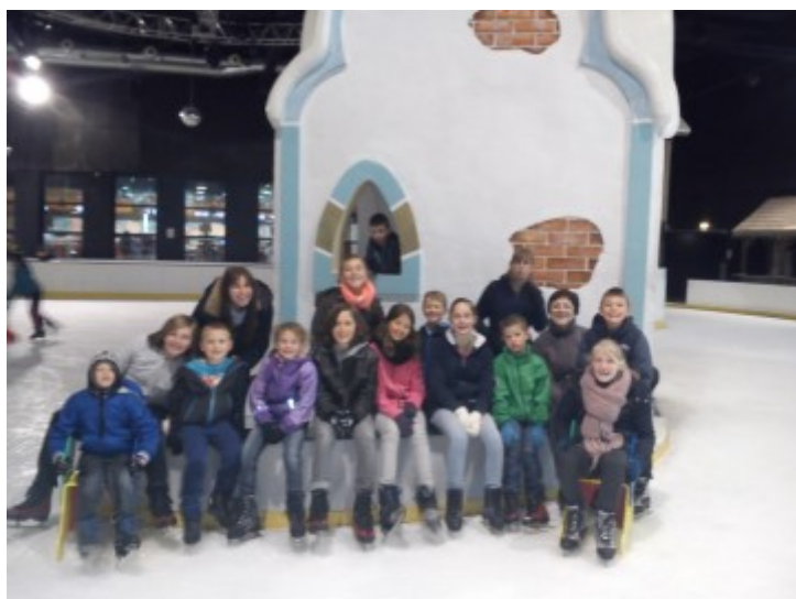
Patinoire de St Quentin

Les enfants sont allés, à la Bulle (piscine et patinoire) et au Kidzy de St Quentin. Un grand jeu avec Hamel a été réalisé sur Estrées pour permettre un échange avec d'autres enfants. Pour terminer ces vacances, une sortie au parc Dennlys Parc a également ravi les petits et les grands. Quand nous restons sur le centre, des activités manuelles sont réalisées et des activités sportives sont mises en place avec les animateurs.