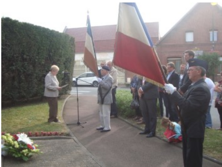
Cérémonie de commémoration de l'appel du 18 juin 1944 avec la participation de Mme Sauvage