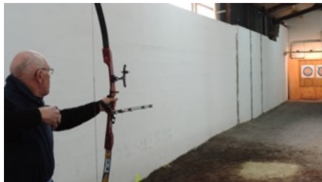
Les travaux et le pas de tir à 25 mètres

✓ l'activité palet Breton pratiquée au sein du COLLECTIF 1026.