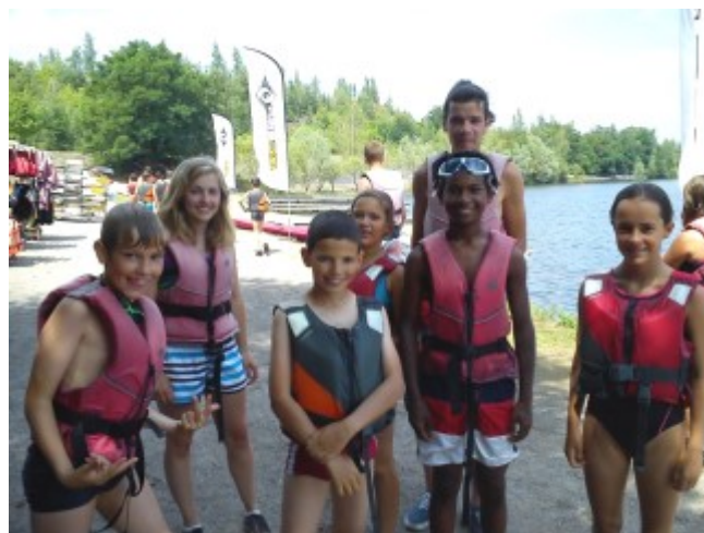
Activité à la base nautique de Rieulay

Des activités manuelles et sportives ont également été réalisées comme la décoration de la remorque pour le défilé du Mont Carmel pour le groupe des grands, préparation des fleurs pour les vélos fleuris, décor pour le spectacle, grands jeux dans Estrées, et sans oublier le spectacle de fin de centre.