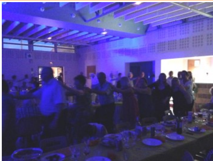
Soirée des fêtes du Mont Carmel