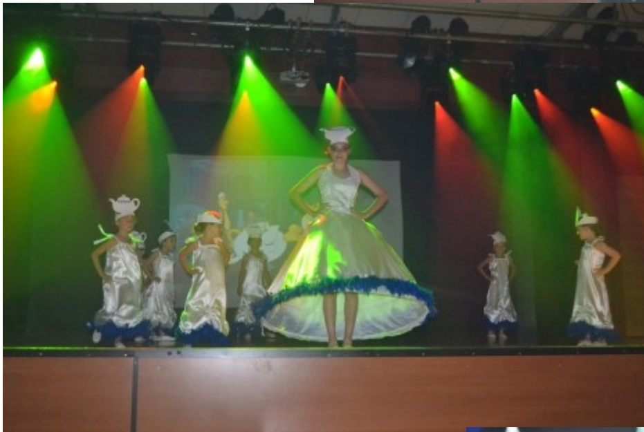
Le groupe des petites