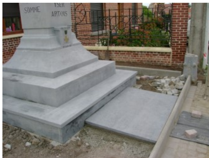
Pose des bordures et du pavage