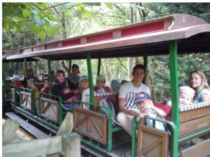
Petit tour en train à Bagatelle