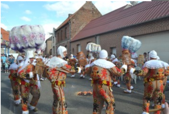
Fin de défilé avec le traditionnel final des Gilles de Saulzoir