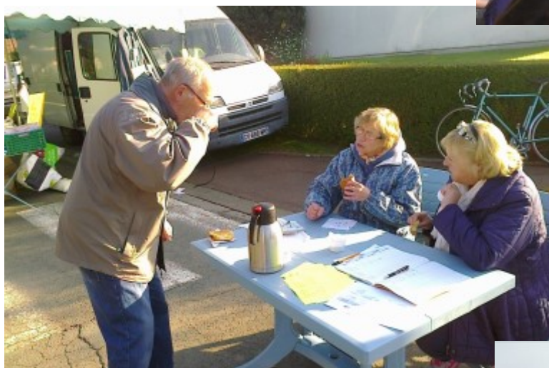
Ducasse de septembre : Brocante organisée par BVE le 26 septembre, prise des inscriptions