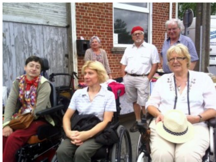
Sortie aux fêtes du Mont Carmel

Bien sûr, des séances jeux de société, cinéma, bowling et réunions de fin de mois, toujours bienvenues, renforcent la cohésion du groupe.