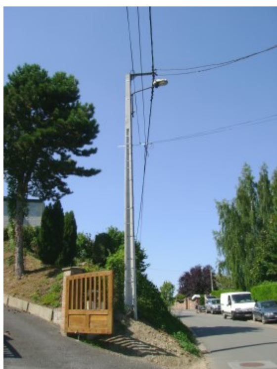
Changement d'un poteau EDF Rue de l'Espérance