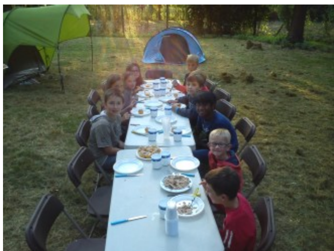
Repas du soir au Fleury