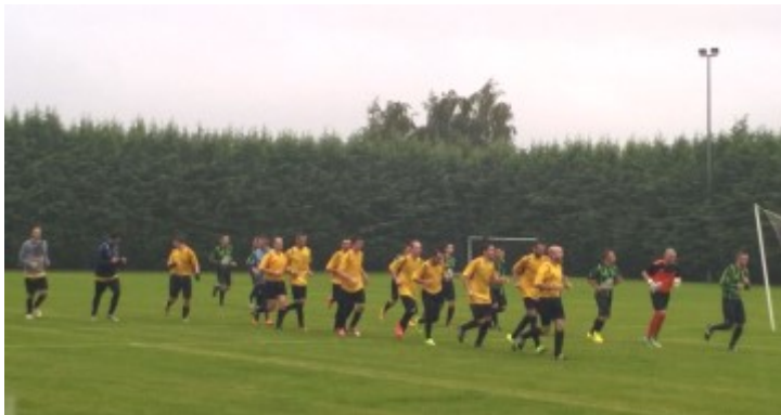
3 ème tour de coupe de France, les équipes entrent sur le terrain

Par contre en championnat, avec 1 victoire et 1 nul, pour les A et un seul match nul pour les B, la sonnette d'alarme est tirée, il va falloir se réveiller!