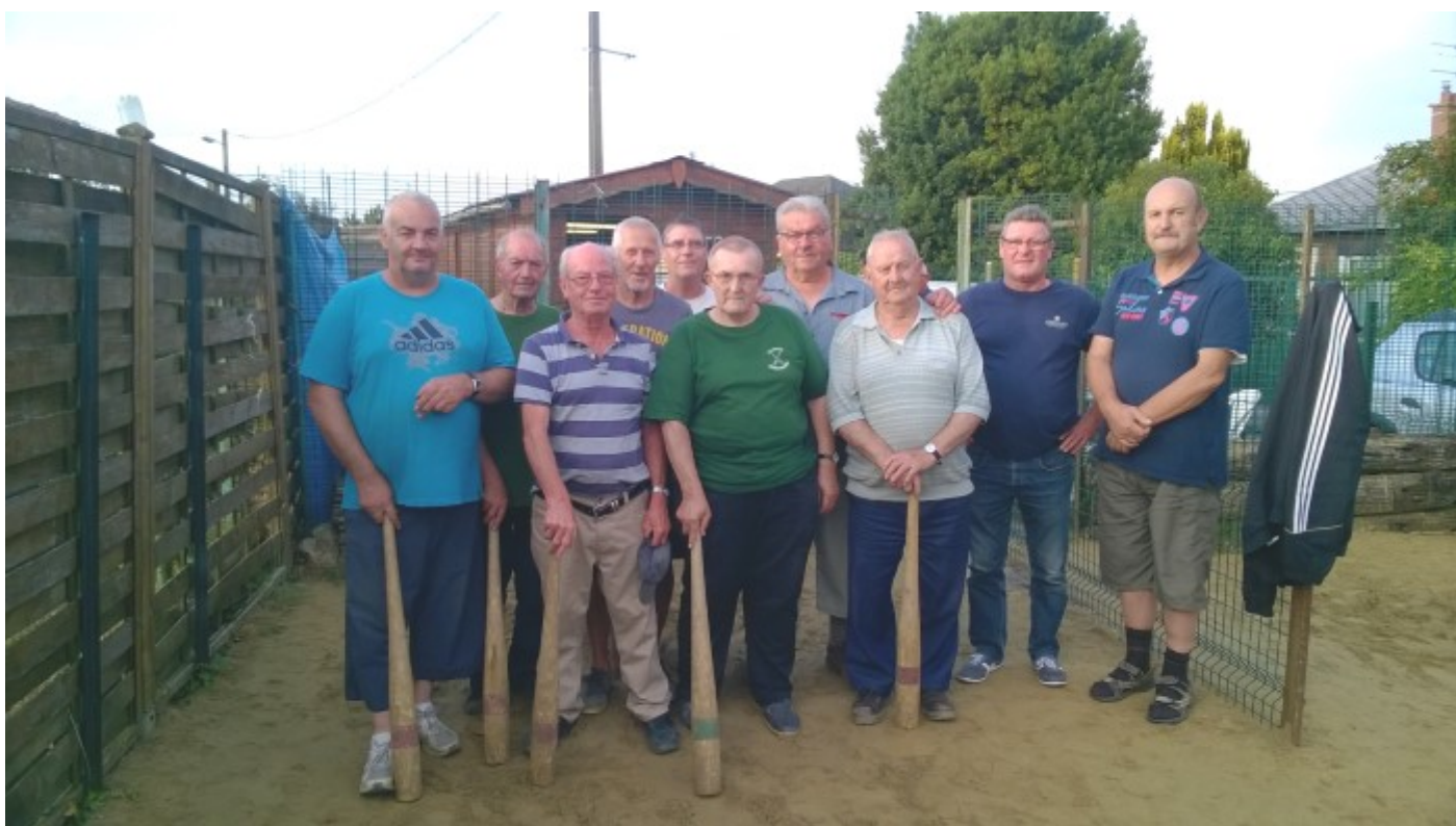
L'équipe de la butte