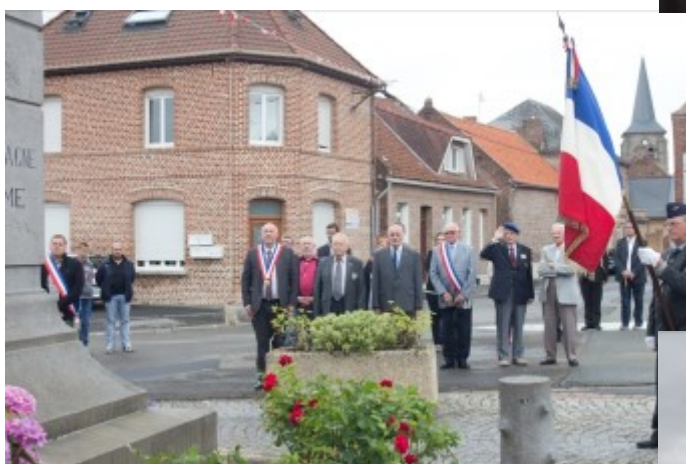
Cérémonie du 14 juillet