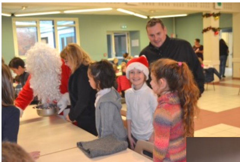
Repas de Noël de l'école lors du dernier repas à la cantine, le 18 décembre