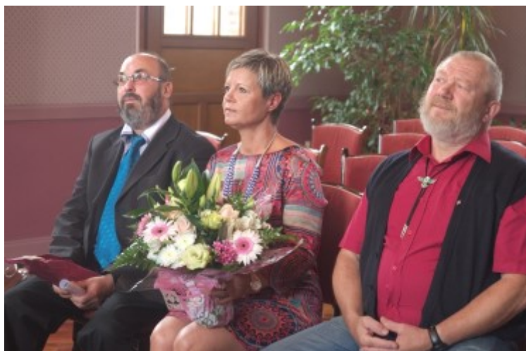
Remise des médailles du travail le 14 juillet