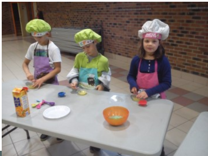
« Cuisine atroce »

Une sortie à la piscine de Vitry en Artois a également eu lieu. Pour terminer cette période de vacances, une journée a été organisée au kidzy pour les plus petits et lazer game et bowling d'Hénin-Beaumont pour les plus grands.