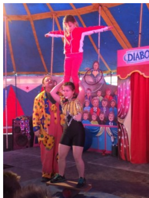
Atelier Diabolo Circus

Durant les vacances de février , l'accueil de loisirs a accueilli 32 enfants pour une période de deux semaines du 23 Février au 6 Mars. Les enfants se sont rendus à Liévin pour une journée cirque à Diabolo Circus, à la piscine de Vitry en Artois, et ont participé à une initiation Djembé avec le groupe « Craque ta peau ». Des activités manuelles et sportives ont également été réalisées.