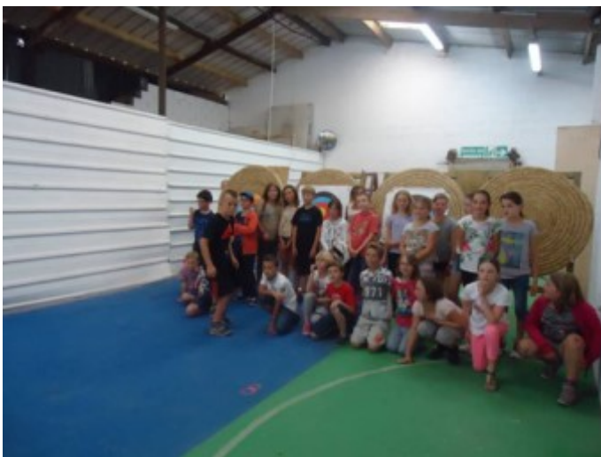
Accueil des centres aérés d'Estrées et d'Hamel