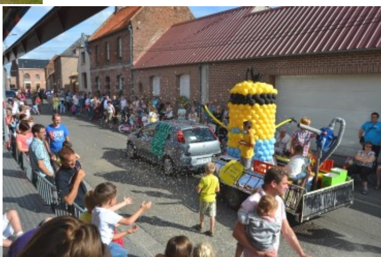
Les fêtes du Mont Carmel du 18 au 20 juillet