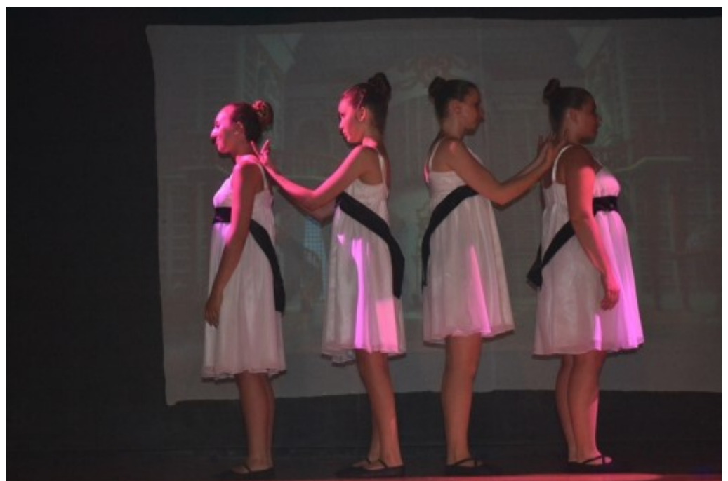
Le groupe des adultes 1