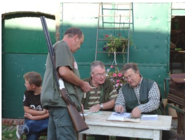
Vérification des permis de chasse