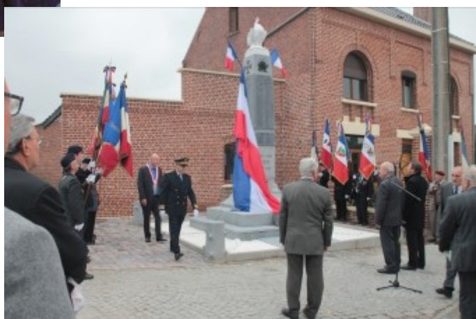
Inauguration du monument aux morts restauré, le 10 octobre