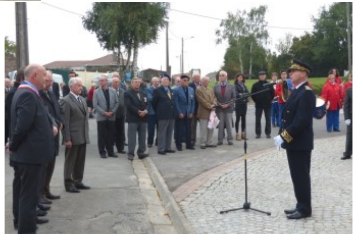
L'allocution de Monsieur le Sous-Préfet