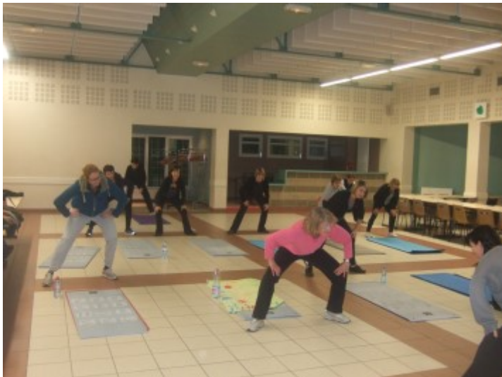
Séances de gymnastique