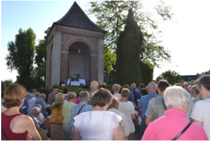
Messe en plein air sous un soleil radieux et une nombreuse assistance