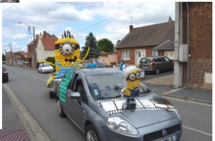
Le char créé par l'APE sur le thème du centre de loisirs : le cinéma.