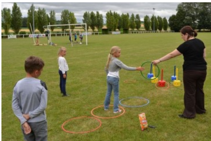
Les jeux proposés par les animateurs du centre de loisirs lors du 14 juillet