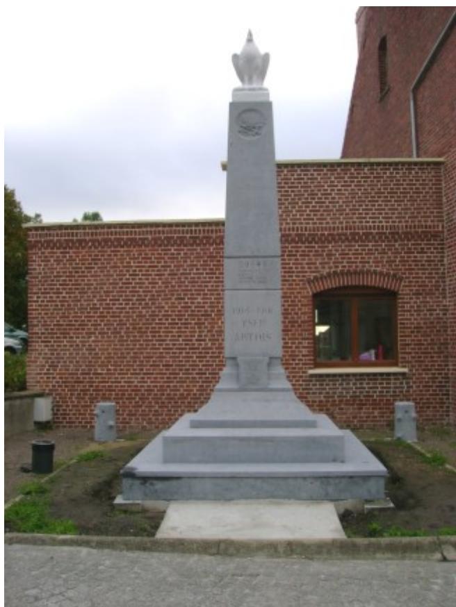
Après les travaux ...