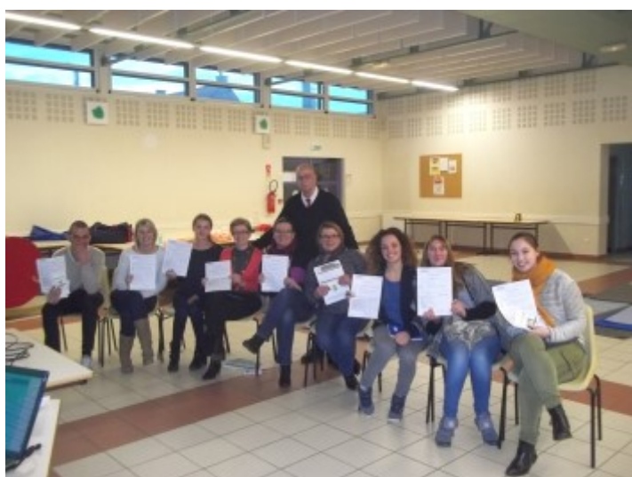
Formation « Sauveteur Secouriste du Travail » du personnel communal pendant les vacances de Noël