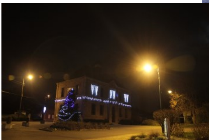
Illumination du village pour les fêtes de fin d'année