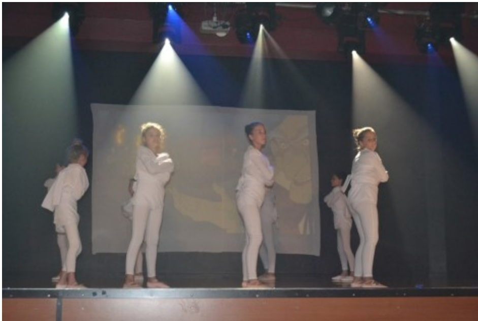
Le groupe des ados

Dernier gala de l'association le 4 juillet à la Salle de Guesnain.