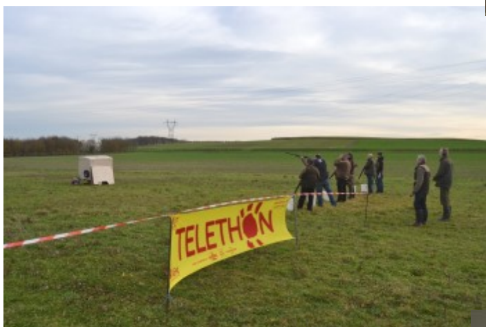
Week-end du Téléthon, les 4 et 5 décembre, avec le ball-trap des Tireurs de la Sensée. Merci à la « Butte Estrésienne » et aux « Tempes Argentées » pour leurs dons.