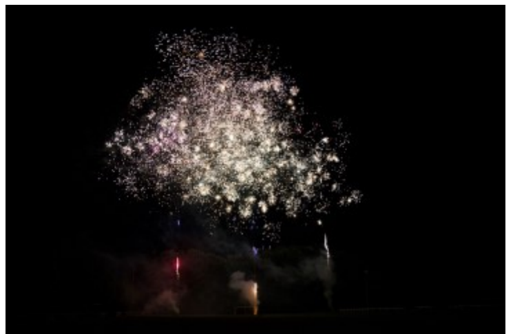
Le feu d'artifice tiré au stade