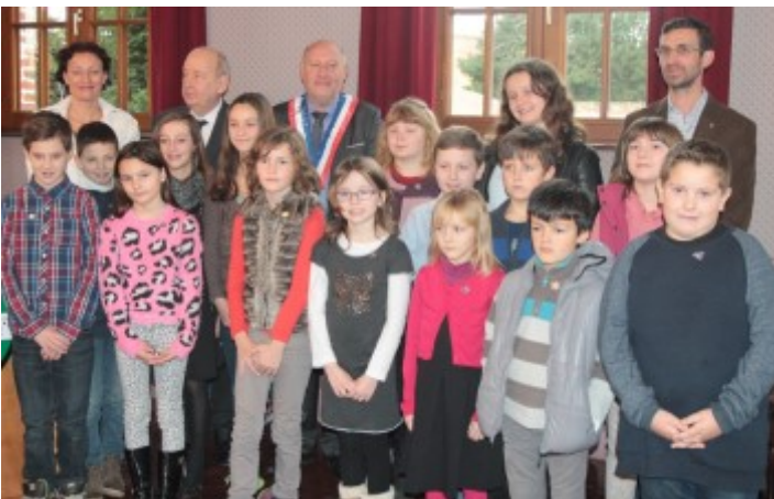
Les 15 enfants du conseil municipal des jeunes