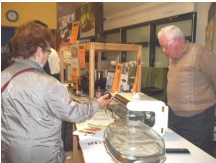
Démonstration d'articles lors du repas gratuit en mars