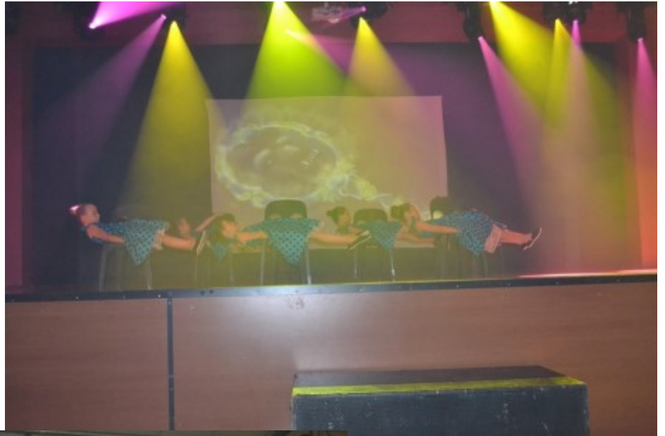
Le groupe des grandes