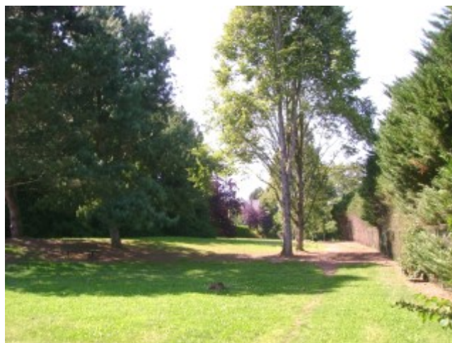
L'élagage des arbres au Mont de la vigne et au terrain de foot.