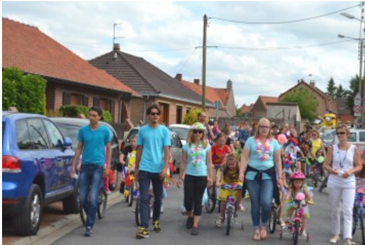
Le défilé des vélos fleuris encadré par les animateurs du centre de loisirs