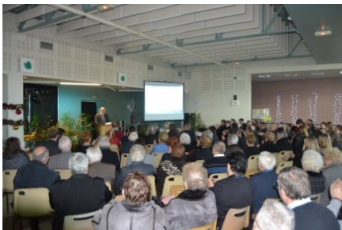
Cérémonie des vœux du Maire, dimanche 11 janvier