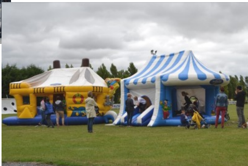
Les jeux au stade