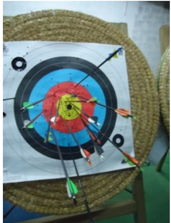
Quelques résultats !!!