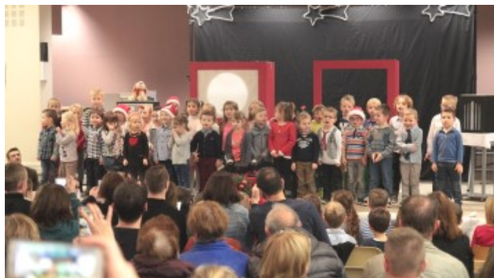
Les petits des classes de maternelles chantent Noël

Au programme : les chants des enfants de l'école Thérèse Gras préparés par les enseignants, suivis d'un spectacle de marionnettes sur l'esprit de Noël et pour finir, le Père Noël nous a fait la surprise de descendre de l'église avec ses lutins avant de venir distribuer les cadeaux aux enfants sages.