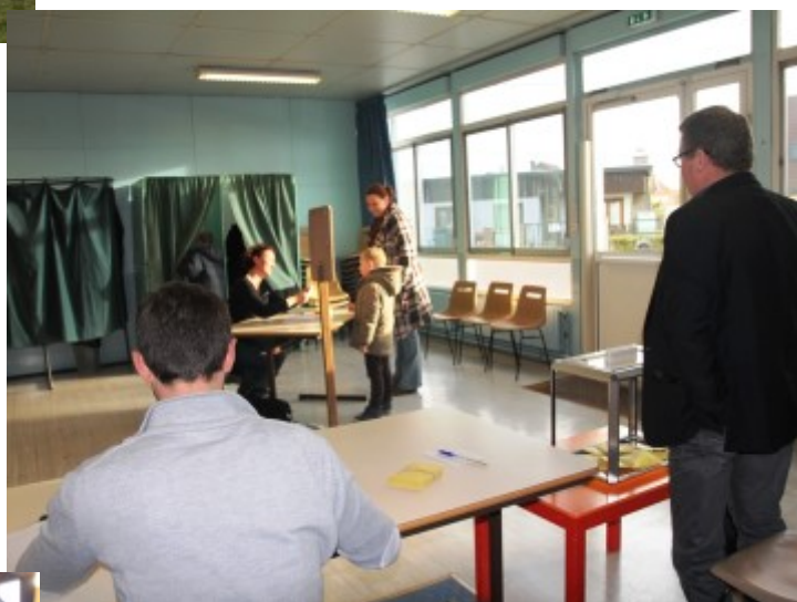
Election du conseil municipal des jeunes, organisée le 5 décembre