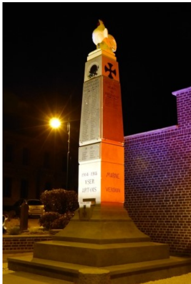
L'éclairage de nuit

C'est grâce à la vente de notre beau calendrier, à la générosité des acheteurs, qui a presque totalement couvert le coût de fabrication de cette plaque de remerciements envers nos aînés de 14-18 et de 39-45, que nous avons pu la déposer lors de l'inauguration.