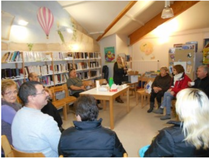
Accueil autour d'un petit café