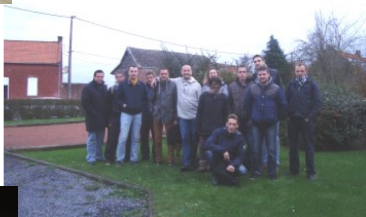
Groupe d'étudiants de Wagnonville en « Chantier Ecole » sur la commune pendant les vacances de Noël