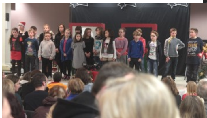
Les élèves de CM chantent en anglais