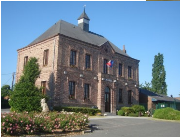
Réfection des peintures extérieures de la Mairie par une entreprise locale au printemps