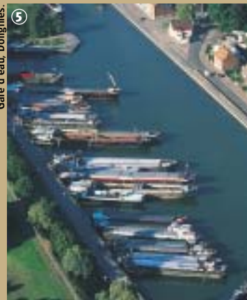
Gare d'eau, Dorignies.

Baudot eut l'idée de faire construire un bateau-chapelle et trois dimanches de suite, il célébra la messe dans la gare d'eau de Douai-Dorignies, sans l'accord de ses supérieurs, prétendant qu'une chapelle n'était pas une paroisse. En 1898, sur ordre de la préfecture du Nord, la chapelle fut fermée. Mais depuis 1973, en souvenir de cet épisode, le Comité des fêtes de Douai-Dorignies organise la Fête de la Batellerie, chaque premier mai. Le matin a lieu le Pardon de la Batellerie avec une messe en plein air dite au milieu des péniches pavées, garées à Dorignies – Douai-Dorignies est le deuxième port marinier de France après celui de Conflans-Saint-Honorine. L'après-midi se déroulent diverses animations au Château Treuffet et notamment un concours de pavoiement. Finalement, à tout seigneur, tout honneur... !