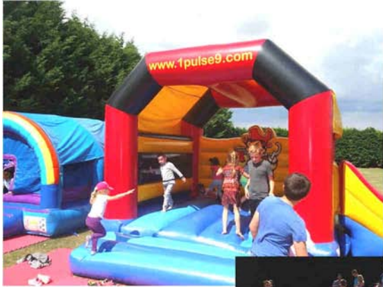
14 juillet : Structures gonflables, jeux et tir à l'arc au stade