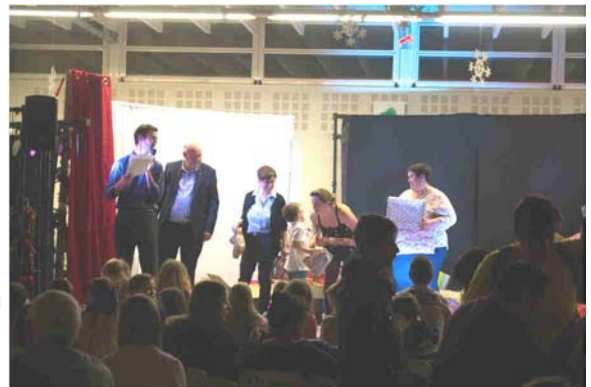
Distribution des colis par la municipalité et de cadeaux par l'APE