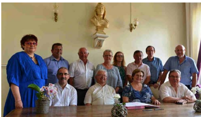
20 juin : Signature de la convention pour la mutuelle communale