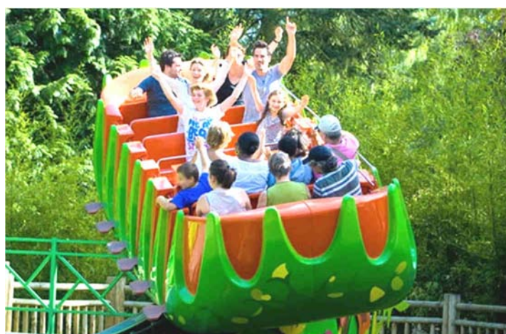
La Mer de Sable

Au cours de la période estivale , les enfants sont partis à la rencontre de multiples sensations à travers le parc d'attractions connu sous le nom de : La Mer de Sable !