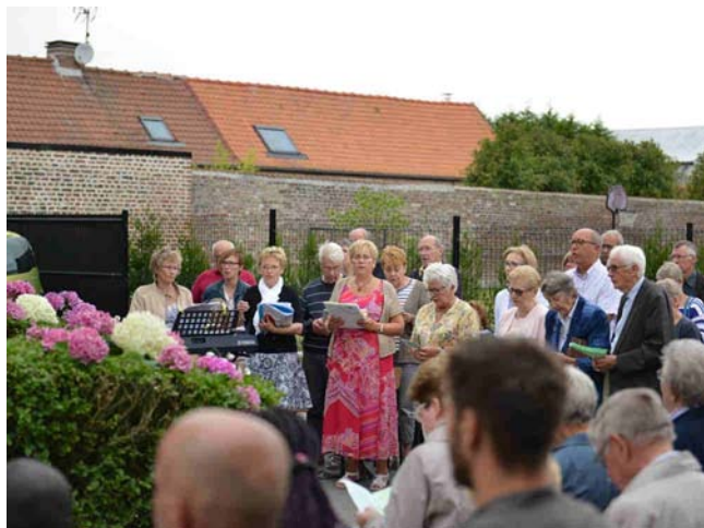
Cette année encore la météo nous a offert une belle messe en plein air !

La fête traditionnelle du village a eu lieu le dimanche 16 juillet. Il s'agissait à l'époque de la principale procession qui avait lieu lors de la fête de Notre-Dame-du-Mont-Carmel. Le cortège traditionnel a été remplacé après la guerre 39-45, par un défilé de vélos garnis et de chars. La tradition perdure toujours à ce jour, les fêtes se déroulent sur 3 jours (du samedi au lundi).