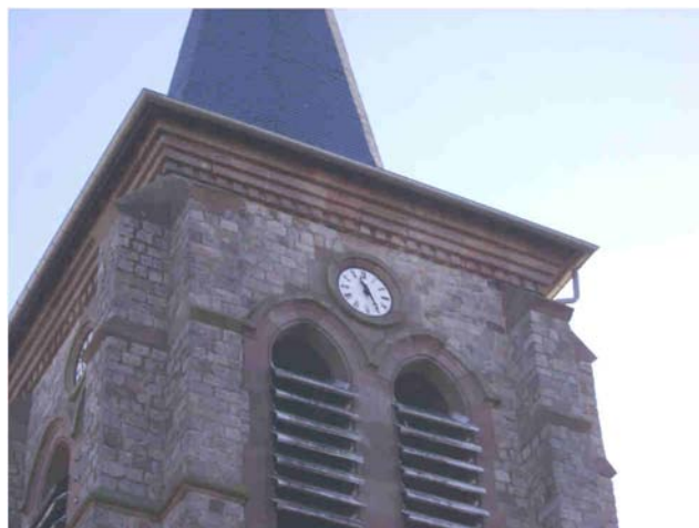
Eglise : remplacement de la platine équipée d'un motoréducteur pour la mise en fonctionnement du cadran de l'horloge