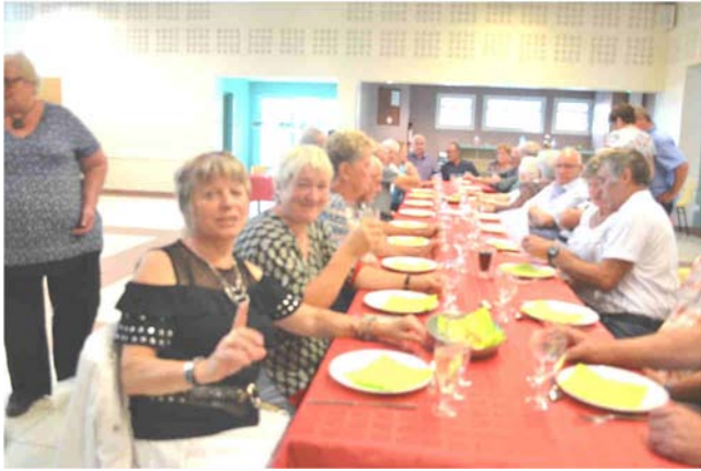
Repas champêtre à la salle André Cauchy