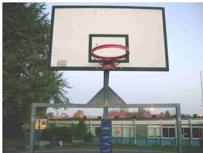
City Stade : mise aux normes des structures