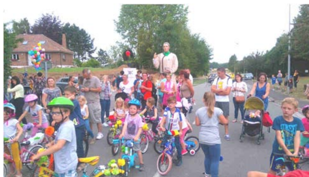
Vélos fleuris pour les fêtes du Mont Carmel