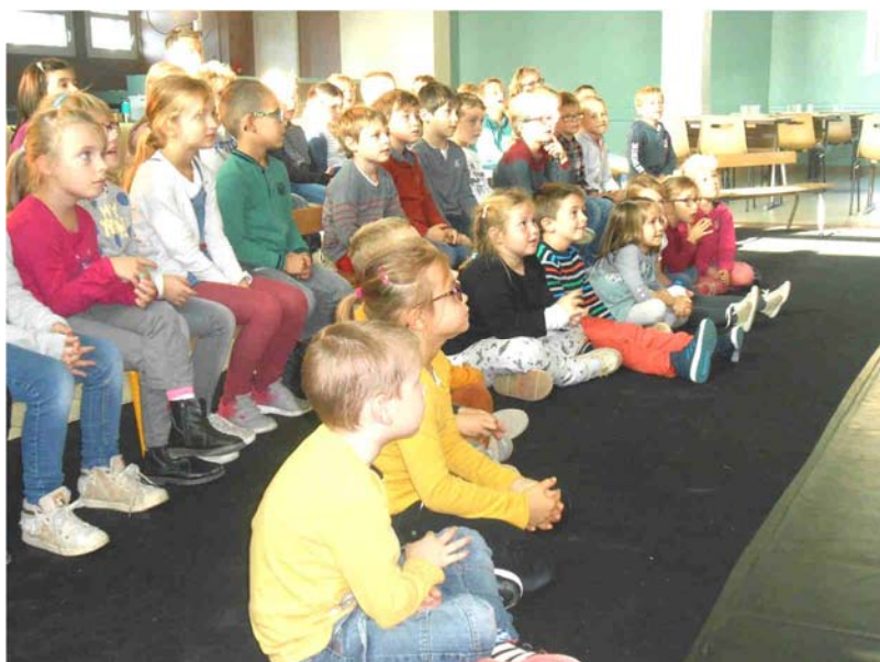
Le spectacle : « Le monde point à la ligne »