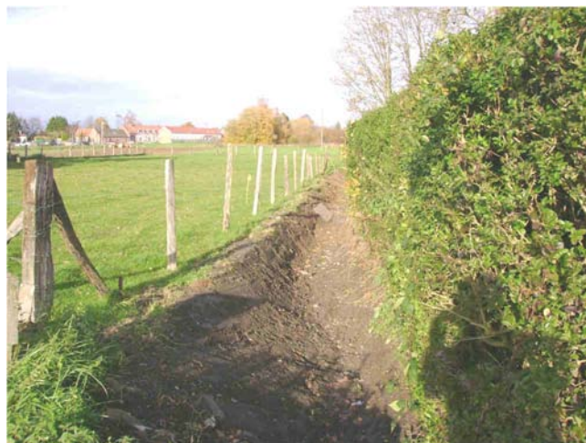
Curage des fossés (rue de Gouy et chemin du Riez)