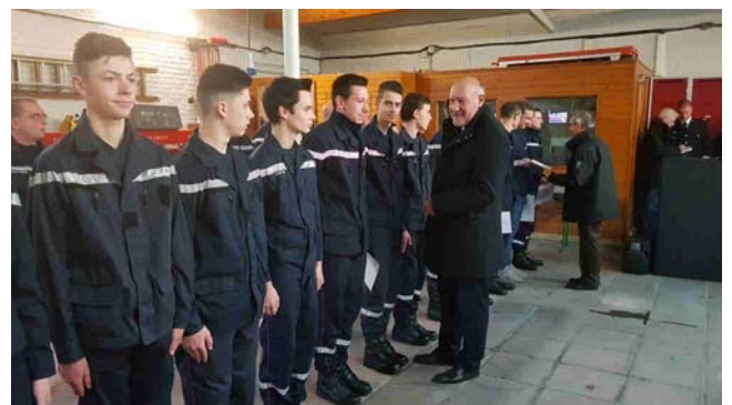
4 décembre : Mise à l'honneur de nos jeunes sapeurs-pompiers lors de la fête de la Sainte Barbe