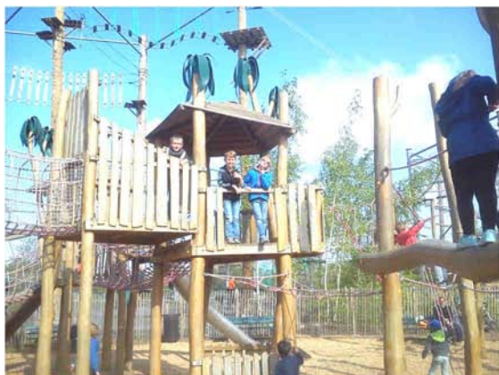
Parc du rivage gayant

Lors des vacances d'Avril , les enfants se sont éclatés au Parc Rivage Gayant : accrobranche, activités nautiques, trampo-élastique et aire de jeux mis à disposition des petits aventuriers !