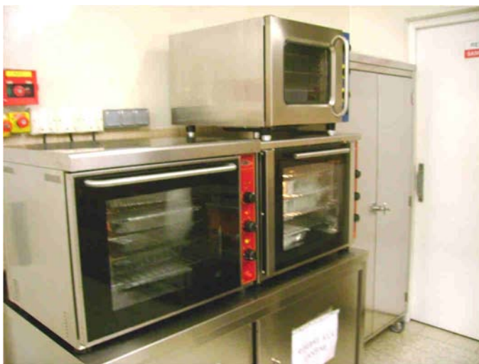
Un nouveau four pour la cantine

Création du pas de tir du local du Collectif 1026