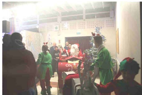
Visite du Père Noël