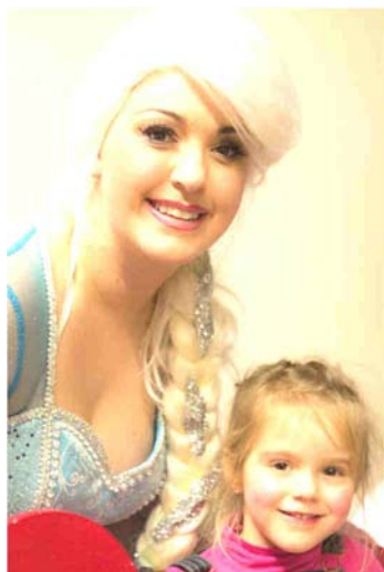
Séance photo avec La Reine des Neiges et le Père Noël !