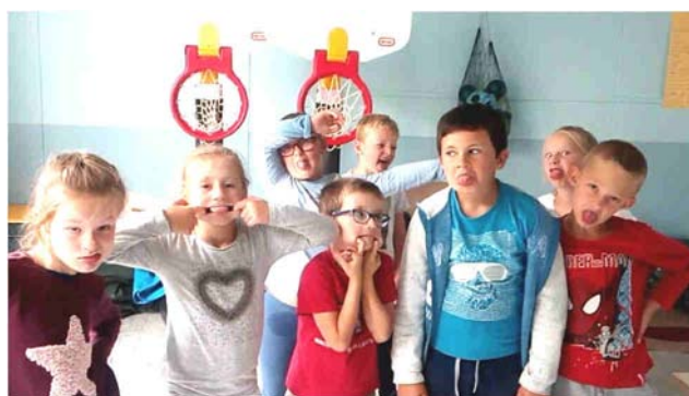
Concours de grimaces

Et enfin, pour les vacances de la Toussaint les enfants ont crapahuté dans l'immense structure de motricité : Kidzy !