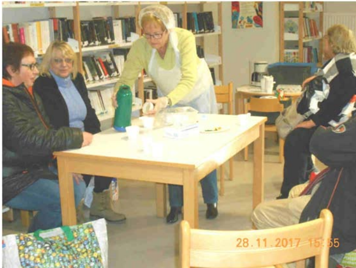
Accueil et café