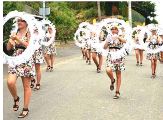
Le traditionnel défilé avec ses fanfares et ses majorettes (sans oublier les mascottes très attendues par les enfants)