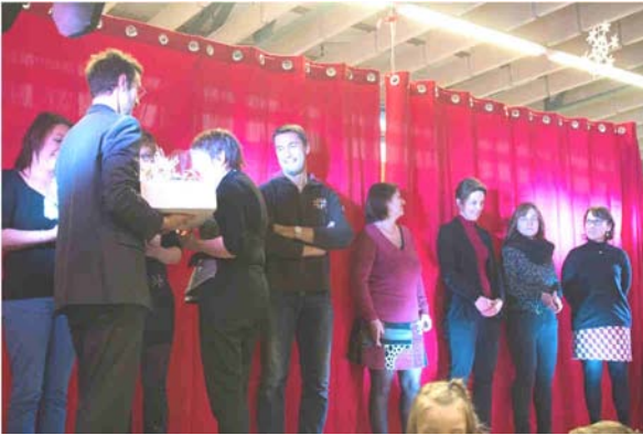
Les instituteurs et les ATSEM mis à l'honneur