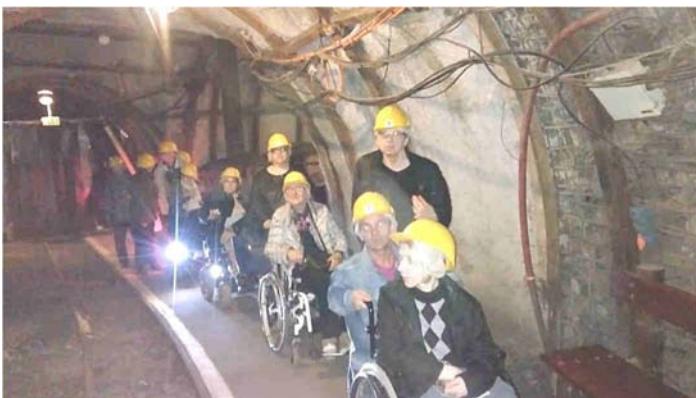
Musée de la mine de Lewarde