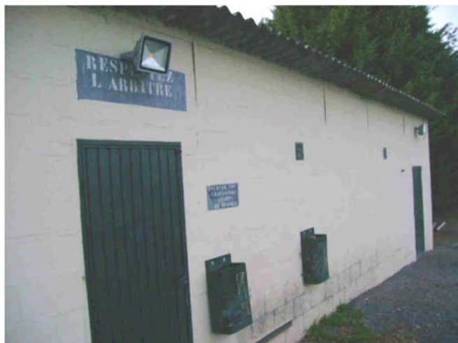
Stade : éclairage extérieur