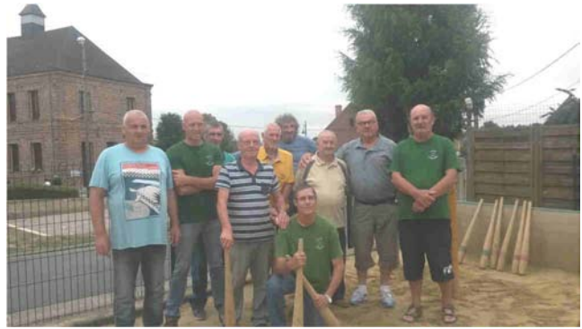
Concours de billon aux fêtes du Mont Carmel