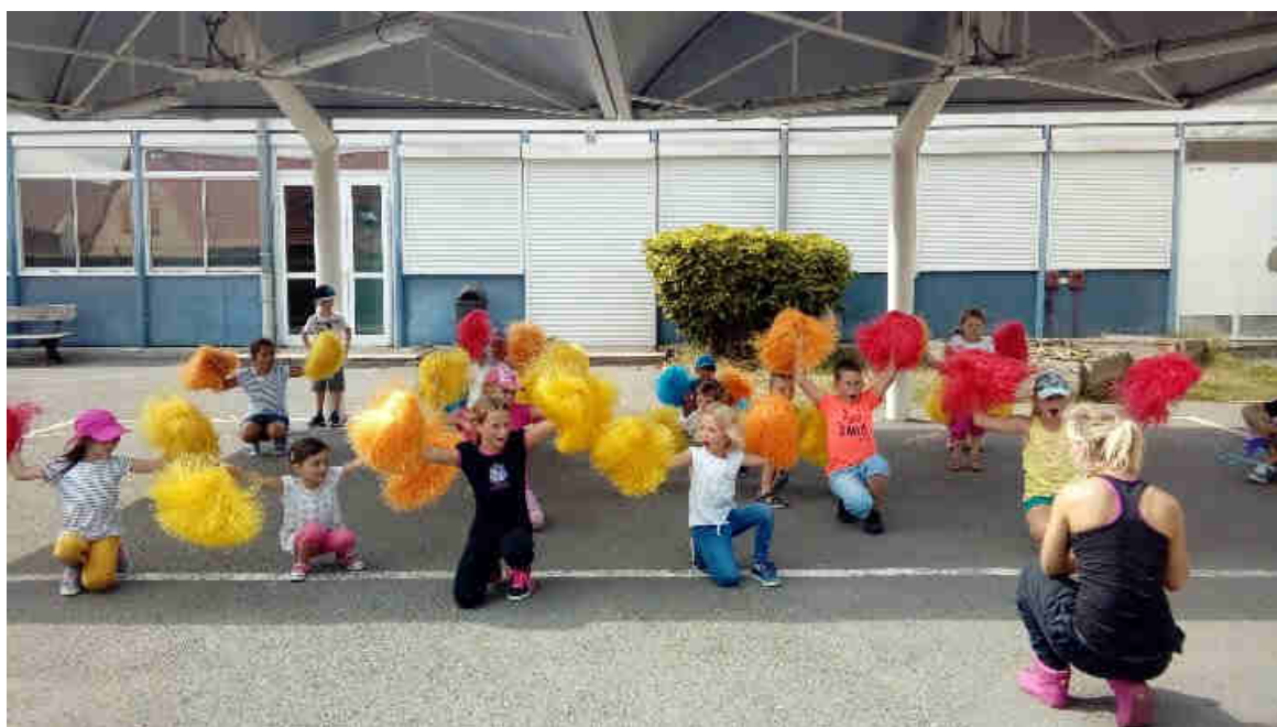
Danse « Pompon »

Chez les tout-petits, la danse « Pompon » est de rigueur pour la préparation du spectacle. Le centre a fait appel à une éducatrice sportive afin de réaliser cette activité.