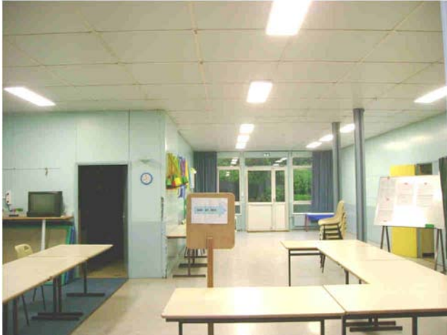
Ecole : éclairage en LED dans le hall des maternelles

Sécurité : installation de 2 radars pédagogiques (rue du Moulinet et rue du Général de Gaulle) financés par le Conseil Général et le fond de concours de la CAD