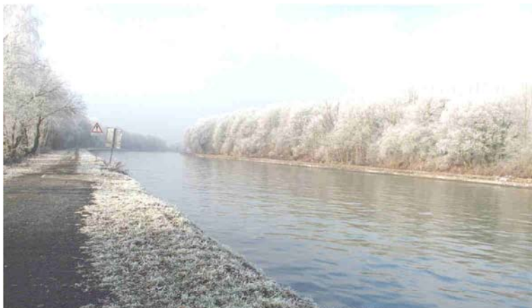
Quelques photos des superbes décors que l'hiver 2017 nous a offerts