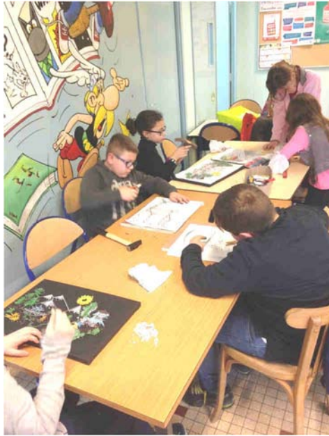
Tableaux de fils