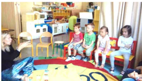
Atelier de lecture

Aux vacances de Février , les enfants se sont transformés en petits pâtisseries pour créer de délicieux gâteaux !