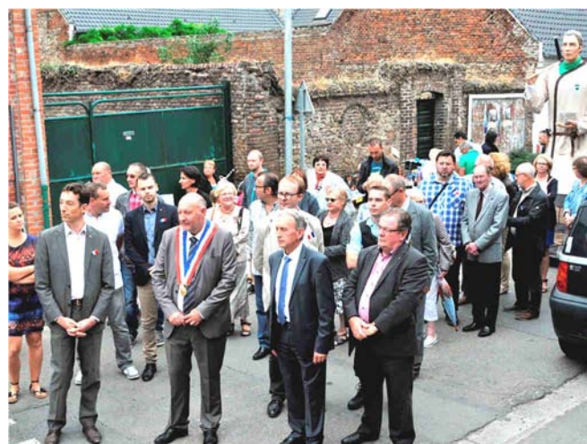
Inauguration lors de la brocante, organisée par les associations, par M. Le Maire entouré des élus et d'Oscar !