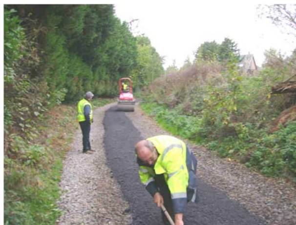
Aménagement du chemin piétonnier du Mont de la Vigne