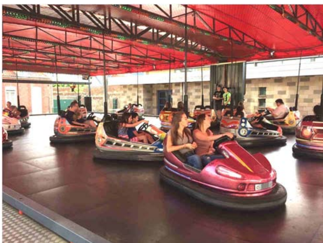
Petits et grands ont pu profiter de la ducasse pendant les 3 jours