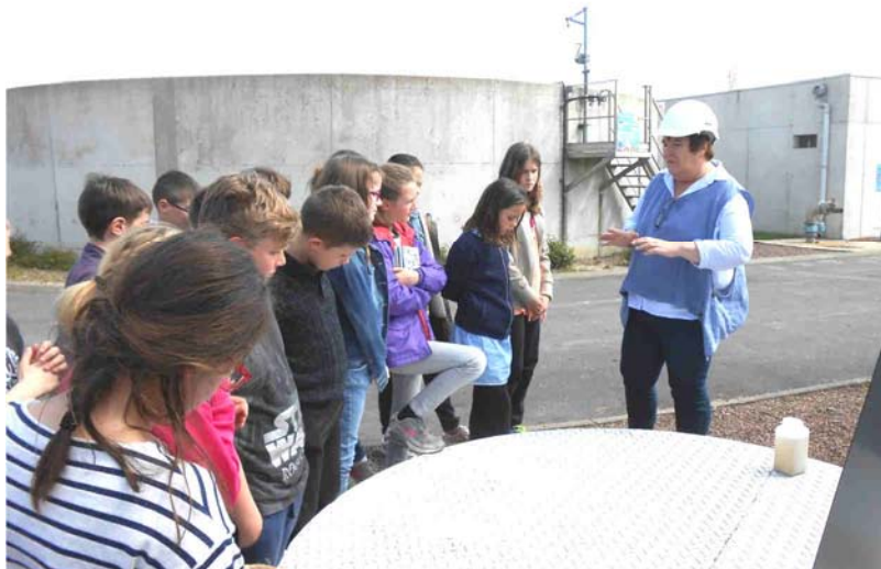
La station d'épuration d'Aubigny au Bac