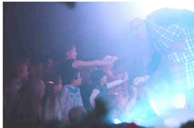
Avez-vous déjà fait des bisous de clown ??