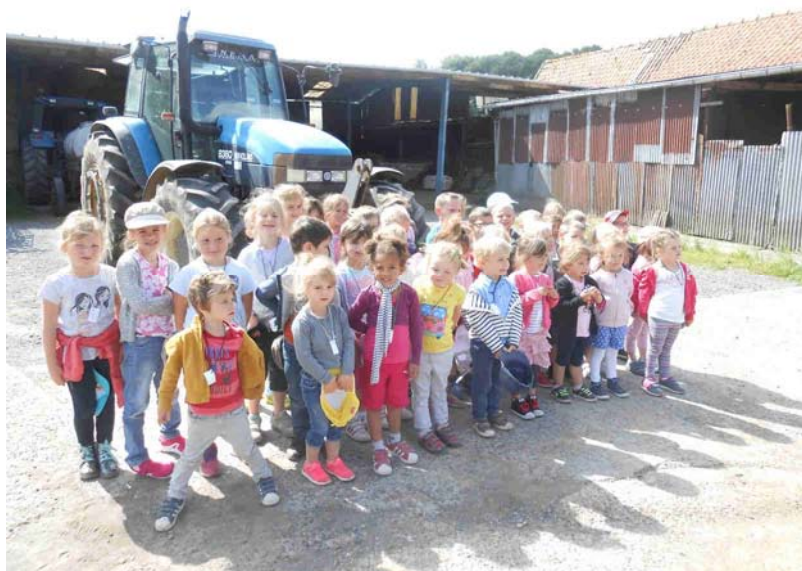
La ferme de Reumont