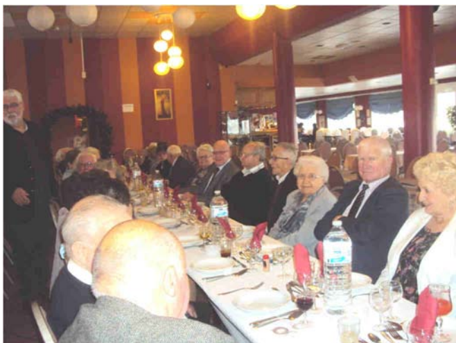
Repas à L'Ermitage