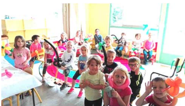
Sculpture sur ballons