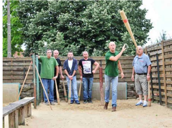
Le club de Billion ouvre ses portes pour faire découvrir ce sport traditionnel !