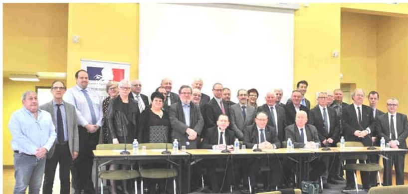
22 mars - Signature du projet « Territoires à Energie Positive pour la Croissance Verte » pour la subvention des travaux de modernisation de l'éclairage public.