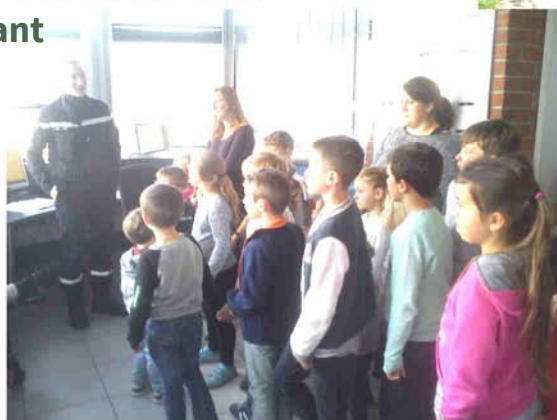
Visite d'une caserne de pompiers