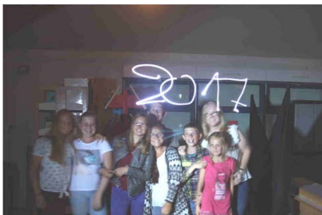
Découverte du light painting