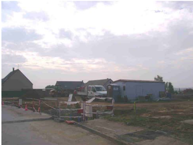
Mont Gratien : création de 8 parcelles à bâtir par un investisseur