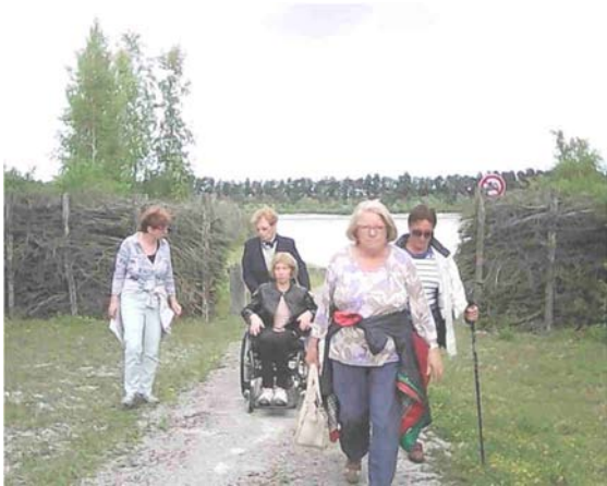
Lac de Cantin