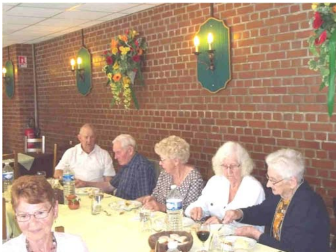
Repas Aux 4 Canaux