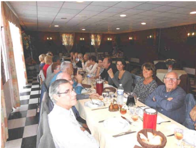
Repas aux 4 Canaux