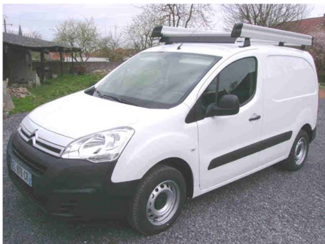
Achat d'un nouveau véhicule aux services techniques