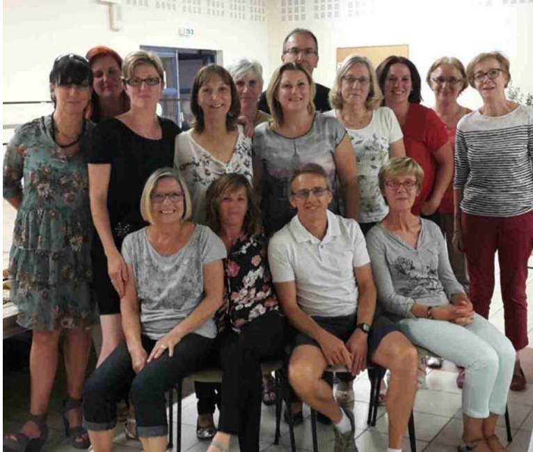
Gymnastique, le pot de fin d'année