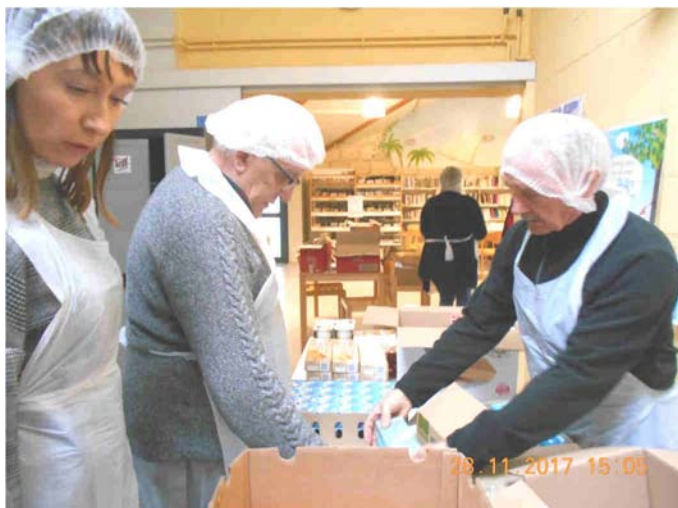
Préparation des stands