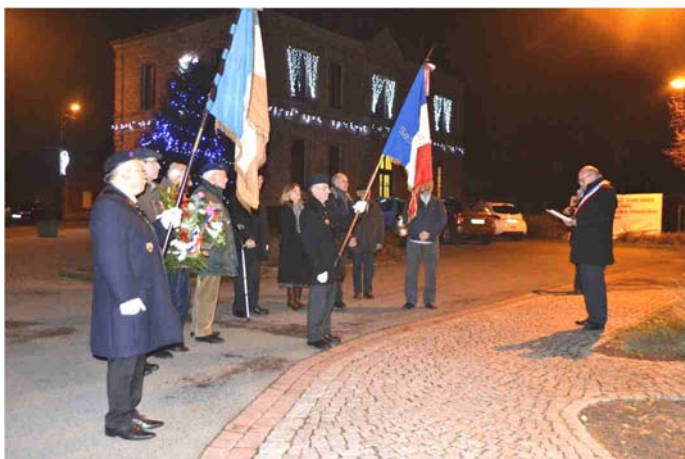
Cérémonie d'hommage aux "Morts pour la France" pendant la guerre d'Algérie et les combats du Maroc et de la Tunisie - 6 décembre