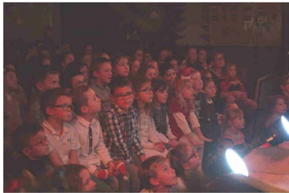
Les enfants subjugués par les personnages du spectacle !