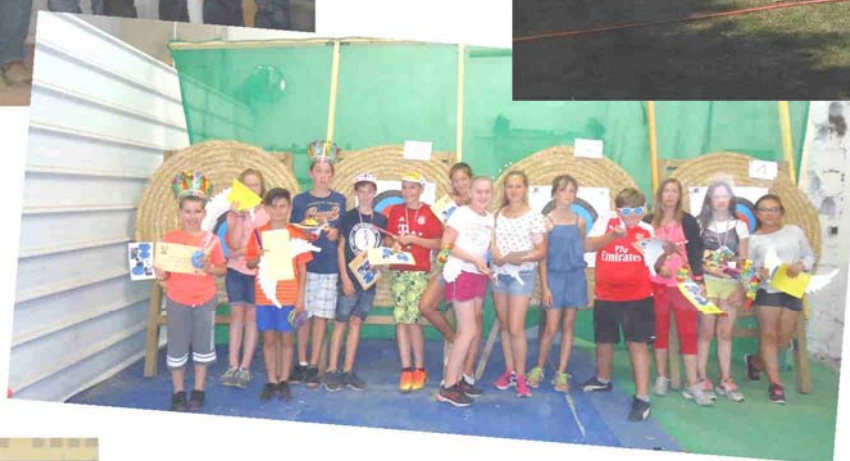
Accueil des enfants du centre de loisirs