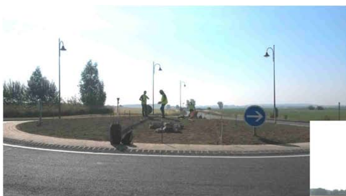
Aménagement du rond-point du Mont Gratien (Chantier réalisé avec le lycée de Wagnonville dans le cadre d'un chantier école)