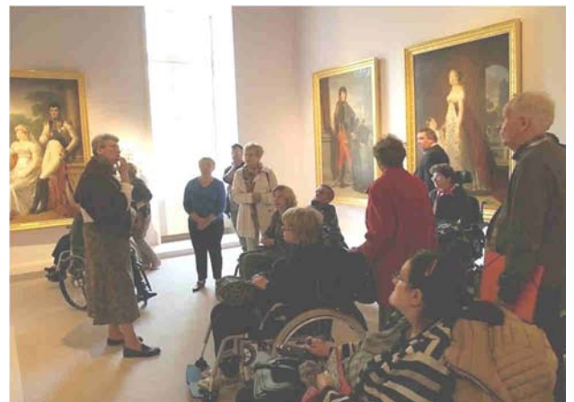
Expo Napoléon au musée d'Arras