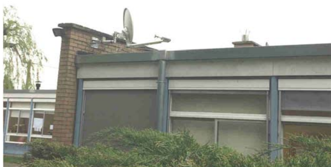
Ecoles : installation d'une parabole et des équipements pour un accès Internet via Nordnet